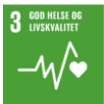
God helse og livskvalitet

Arbeidet med likestilling og ikke-diskriminering har hatt stort fokus i virksomheten i lang tid, med økt fokus siden lovendringen i 2020. I 2022 er det blitt utarbeidet en overordnet HR strategiplan og det er utarbeidet en ny strategiplan for DPSet for perioden 2023 – 2026. Med oss i strategiplanen har vi tatt med FNs bærekraftsmål. Gjennom en arbeidsprosess med alle ansatte har vi kommet frem til at vi skal ha ekstra fokus på 3 av bærekraftsmålene som er: